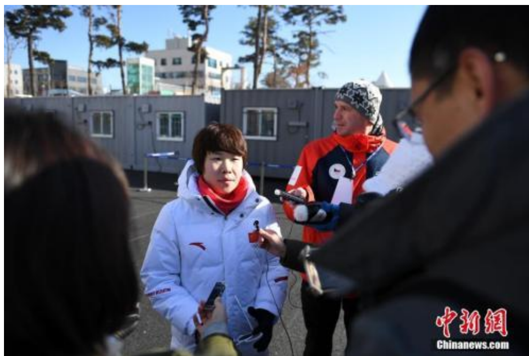
周洋接受媒体采访。

平昌是周洋奥运之旅的第三站。8年前在温哥华，19岁的周洋从韩国队的集体战术中突围，粉碎了对手在短道速滑女子1500米项目上三连冠的美梦，并与队友一道获得3000米接力冠军；4年前在索契，周洋终点线前超越沈石溪，上演了最完美的绝地反击，卫冕1500米金牌。