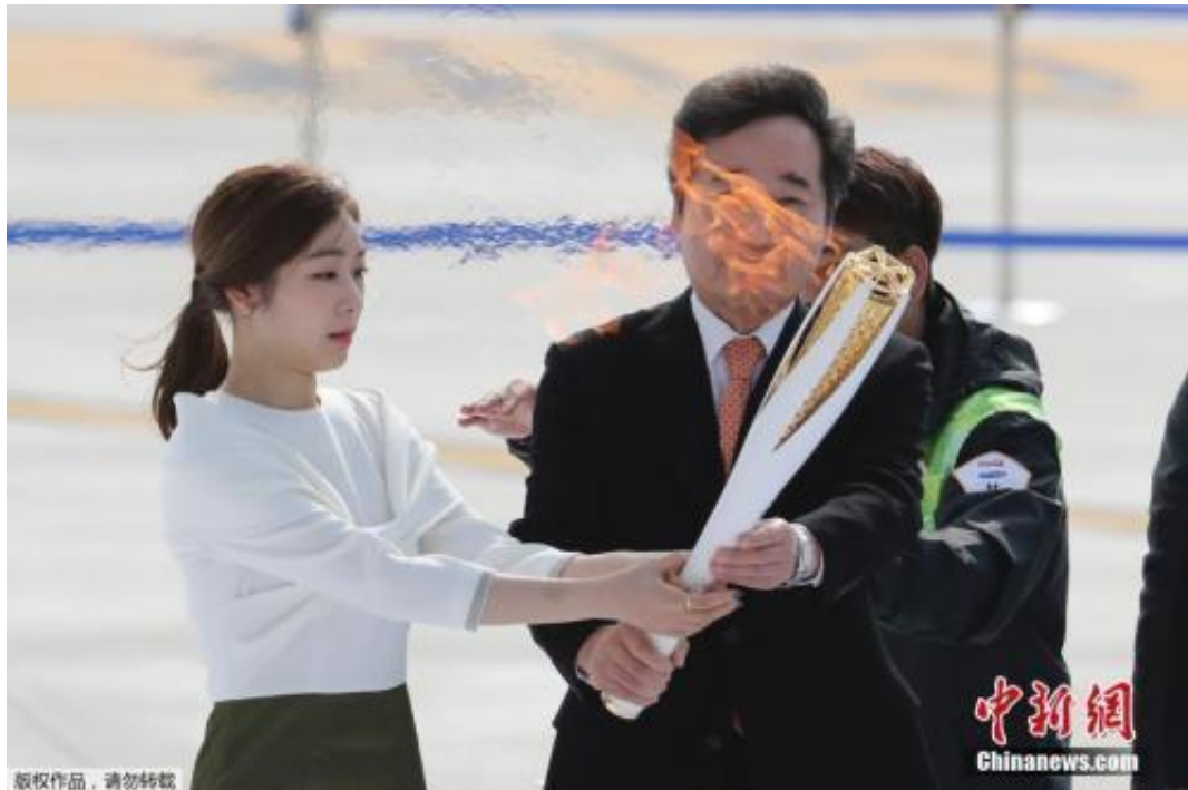
资料图：韩国总理李洛渊(右)、平昌冬奥宣传大使金妍儿(左)手持圣火。

在大田，火炬曾在两个机器人之间传递；在原州市，两名火炬手在悬索桥上完成交接；在济州，火炬传递曾在海水中进行；在江原道，奥运火炬又登上热气球在空中传递……回顾圣火传递过程，可谓创意十足。